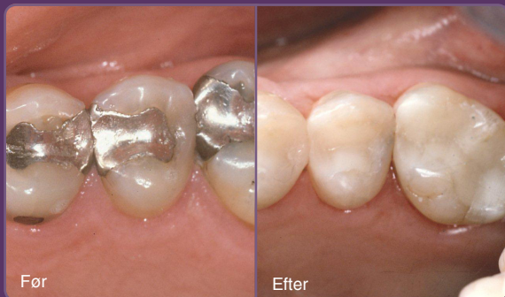
Gamle sølvfyldninger kan let skiftes ud med plastfyldninger.