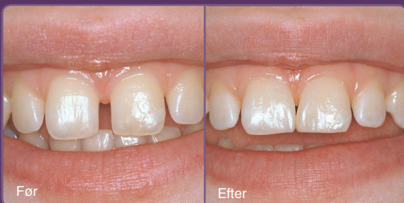
Lukning af mellemrum mellem tænder kan med flot resultat laves med plast.