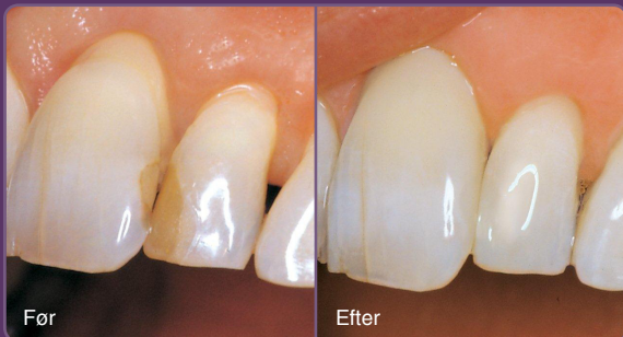
Plastfyldninger misfarves over tid og kan med stor effekt skiftes.